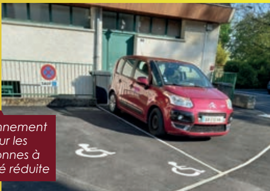
Stationnement pour les personnes à mobilité réduite