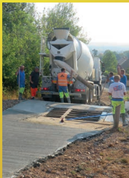
Rénovation du pas canadien (évacuation des eaux pluviales) en haut de la rue Gaston Roupnel