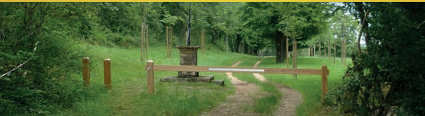
Barrière allée des Tilleuls