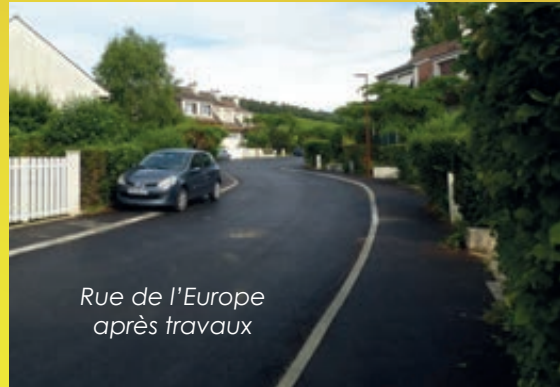
Rue de l'Europe après travaux