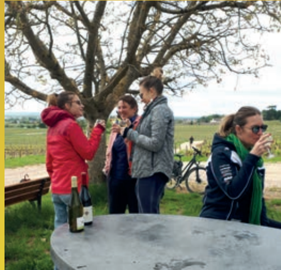
Chemin de Mazerolles table de pique-nique nouvellement installée et déjà très appréciée