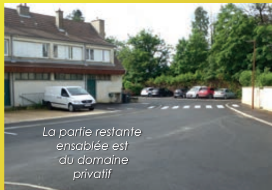
La partie restante ensablée est du domaine privatif