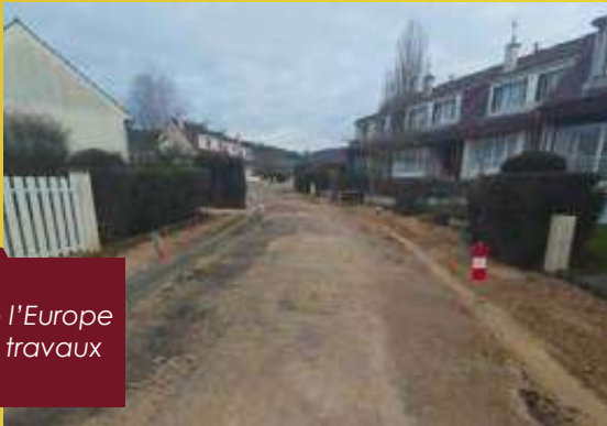
Rue de l'Europe avant travaux