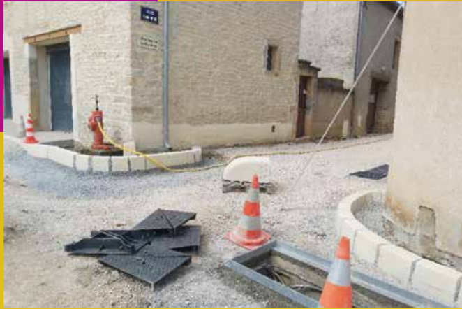
Rue Pasteur pendant travaux