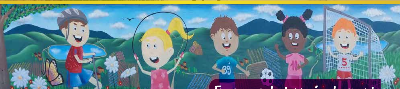
Fresques du terrain de sport