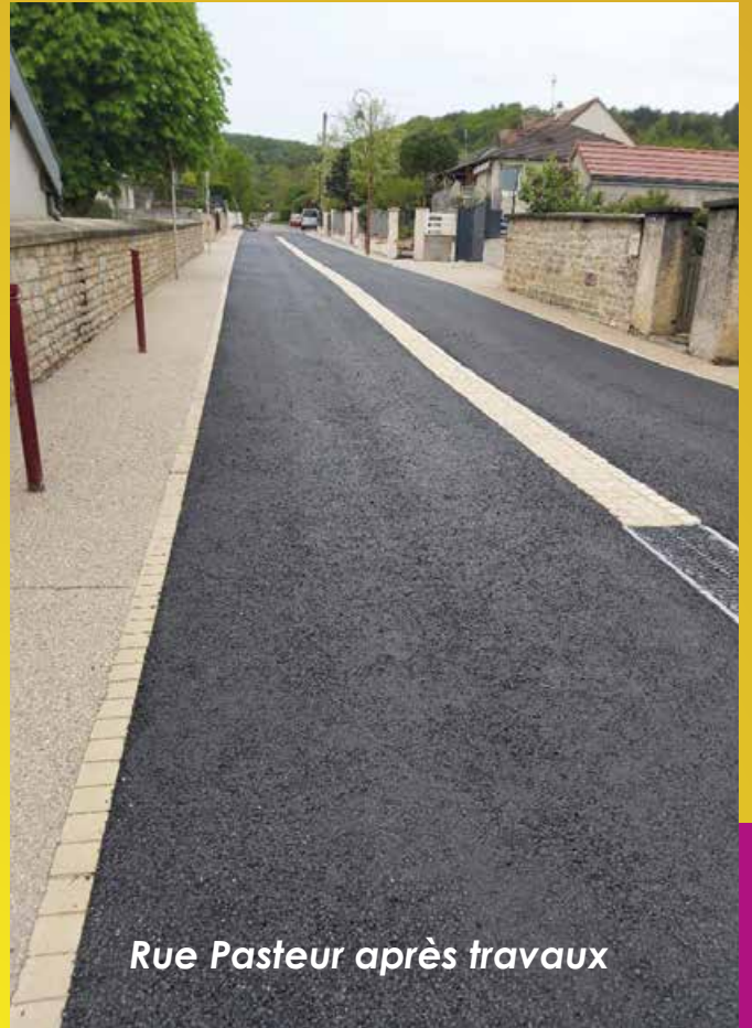
Rue Pasteur après travaux