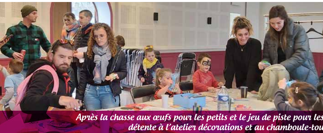
Après la chasse aux œufs pour les petits et le jeu de piste pour les plus grands... détente à l'atelier décorations et au chamboule-tout