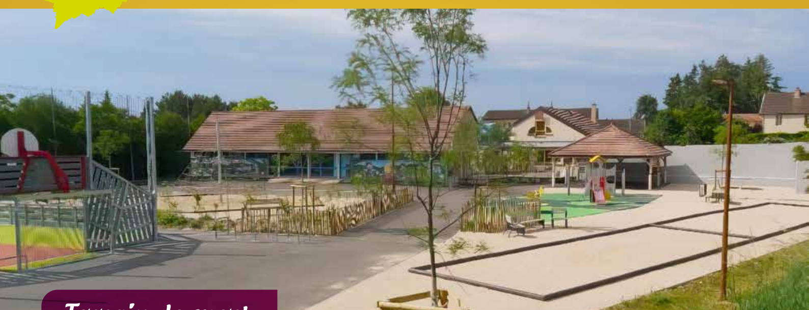
Terrain de sport