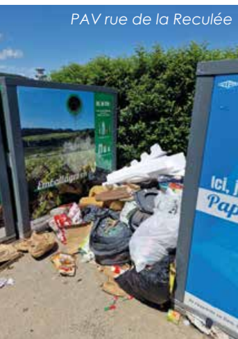
PAV rue de la Reclée

Les mégots de cigarettes, les papiers de bonbons, les chewing-gums, les tickets des distributeurs bancaires, les publicités dans ma boîte aux lettres, les boîtes d'hamburgers, les emballages divers ... jetés dans la rue, renvoient l'image d'une ville sale. Ils contribuent à polluer notre environnement et mettent plusieurs années avant de se décomposer. Leur ramassage coûte cher à la collectivité. J'utilise les poubelles situées à proximité.